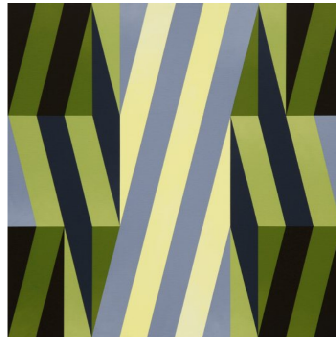
Brez naslova, akril na platnu, 60 x 60 cm, 2012